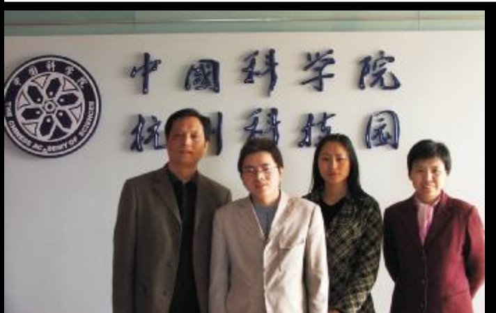
时代光华杭州教学中心 工作人员集体合影

中国科学院杭州科技园培训中心位于被誉为“杭城硅谷”所在区的中科院杭州科技园大楼内(学院路50号)。这里交通便利、环境整洁、设施先进。