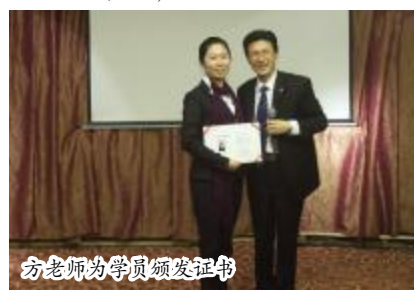
方老师为学员颁发证书

让我们翘首期盼时代光华TTT企业培训师课程第六期(4月28-29日,温州)、第七期(6月9-10日,杭州)的到来!